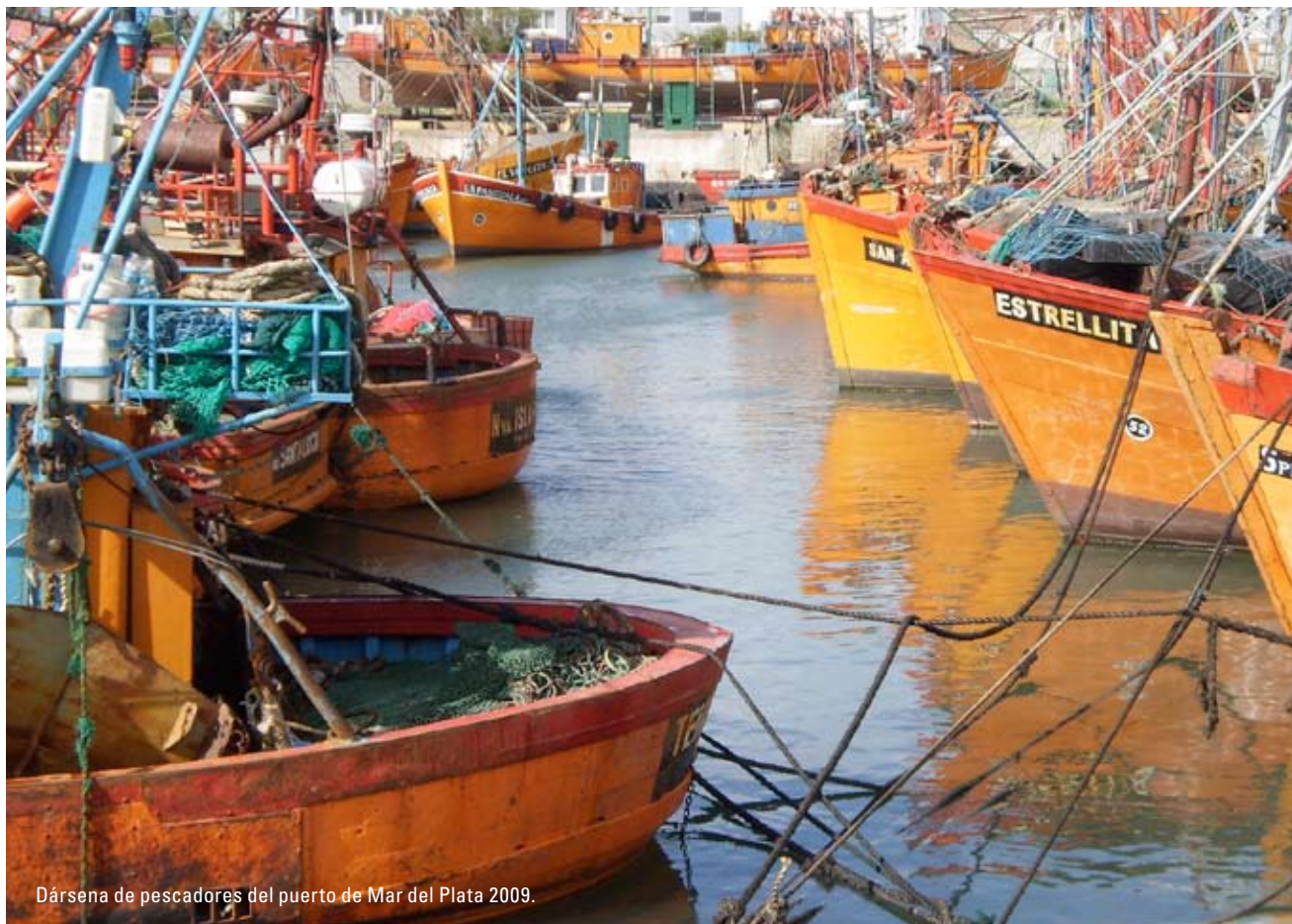
Dársena de pescadores del puerto de Mar del Plata 2009.

En nuestro país, todos estamos al tanto en mayor o menor medida de las novedades de la agricultura y la ganadería, más allá de cuan directamente nos afecten. Sin embargo, las pesquerías si bien son una importante fuente de ingresos para la Nación, son muy poco conocidas por el público y generalmente se las asocia con una sola especie, la merluza. Este artículo intenta presentar otro recurso que es casi completamente desconocido, tal vez por no formar parte de la cultura alimenticia de la población.