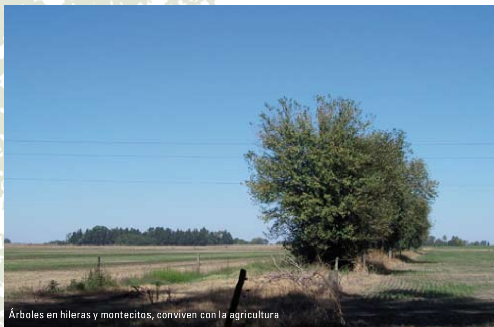
Árboles en hileras y montecitos, conviven con la agricultura

ma. Adquieren importancia entonces las áreas de escasa superficie como un modo de proteger la riqueza específica. No obstante, las áreas pequeñas no son una alternativa a las grandes áreas protegidas sino un complemento de las mismas (12) , pero son la única opción cuando no hay tierras disponibles con fines conservacionistas.