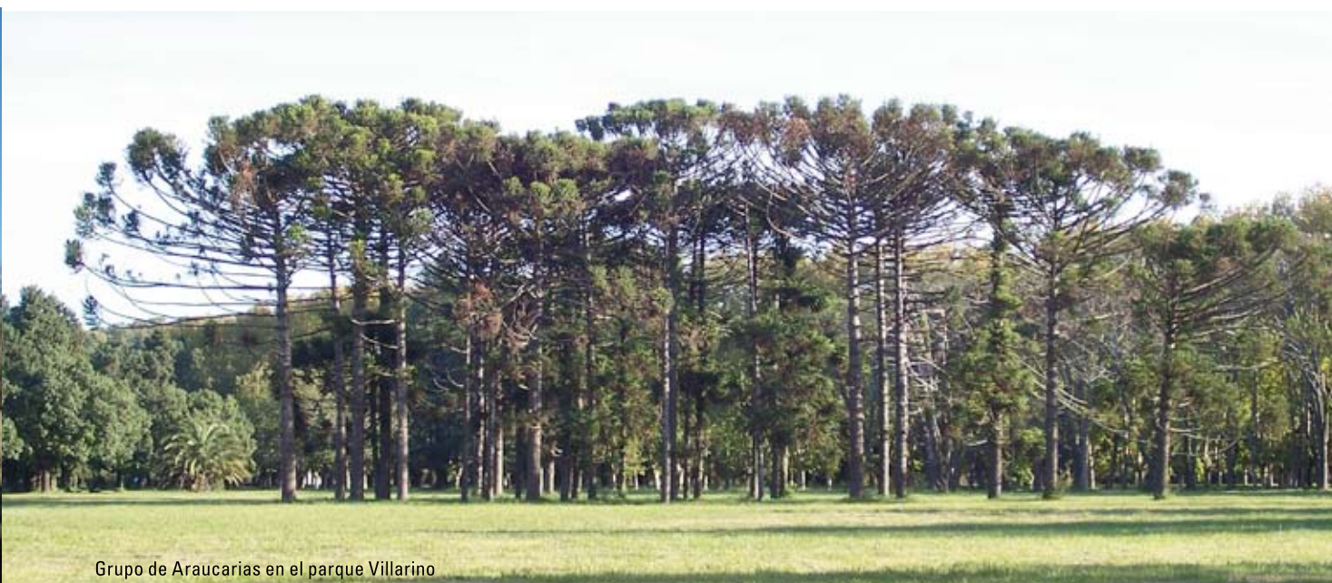
Grupo de Araucarias en el parque Villarino

región pampeana ha sido tan profunda que parece poco probable un retorno a la vegetación original. La presencia de especies leñosas (10) , fundamentalmente en las áreas topográficamente más elevadas, son un elemento ahora común del paisaje de la llanura, encontrándose en montes frutales, forestaciones, costados de caminos, parques, jardines, arbolados urbanos, etc. Estas comunidades se han convertido en refugio de especies nativas vegetales y animales y concentrarían mayor biodiversidad que su entorno. Este