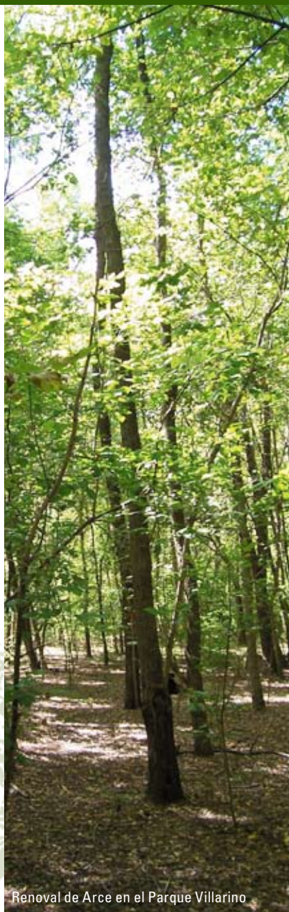
Renovación de Arce en el Parque Villarino

El Parque Villarino es un centro relevante de biodiversidad regional, en el que tienen lugar procesos de invasión y propagación de especies adventicias. También actúa como refugio de especies nativas y tiene un alto valor educativo, estético y recreativo. Tradicionalmente es lugar de recolección de leña y frutos (nueces) para los lugareños. Es un espacio verde único en una amplia región agropecuaria, y es de gran interés para el estudio de la dinámica de esta nueva vegetación que parece haber llegado para quedarse. El parque posee un valor que va mucho más allá del atractivo estético o recreativo y es necesario que tomemos conciencia de ello, para favorecer su cuidado y conservación.