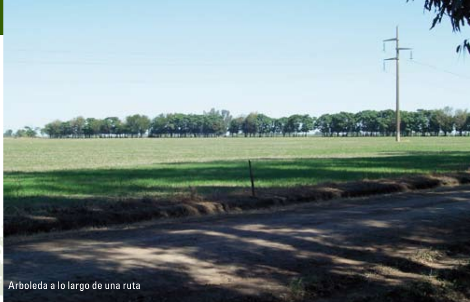
Arboleda a lo largo de una ruta

En la Región Pampeana se asienta la mayor parte de la población de la República Argentina y se concentra la mayor actividad agrícola, ganadera e industrial, por lo que su vegetación natural o prístina se encuentra muy alterada. Si bien Argentina fue un país pionero en la creación de parques nacionales, el número y la extensión de los mismos, como así también de otro tipo de áreas protegidas, no guarda relación con la superficie de su territorio ni la variedad de sus hábitats, y esto es particularmente cierto para la región pampeana, donde la posibilidad de crear áreas protegidas en zonas de tierras altas es cada vez más lejana o imposible, pues casi no se encuentran relictos de la mis-