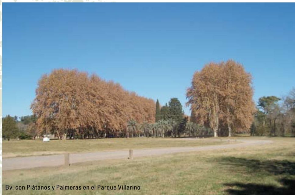
Bv. con Plátanos y Palmeras en el Parque Villarino