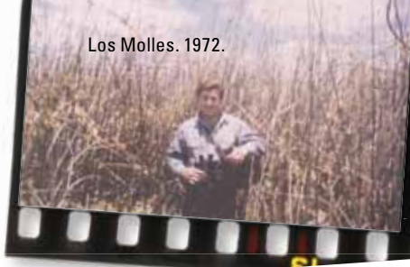
Los Molles. 1972.