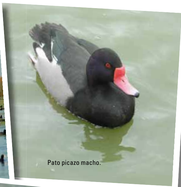
Pato picazo macho.