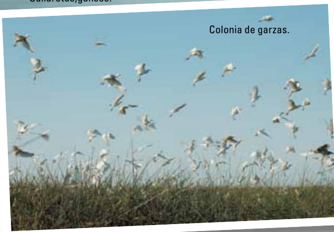
Colonia de garzas.