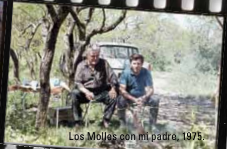
Los Molles con mi padre, 1975.