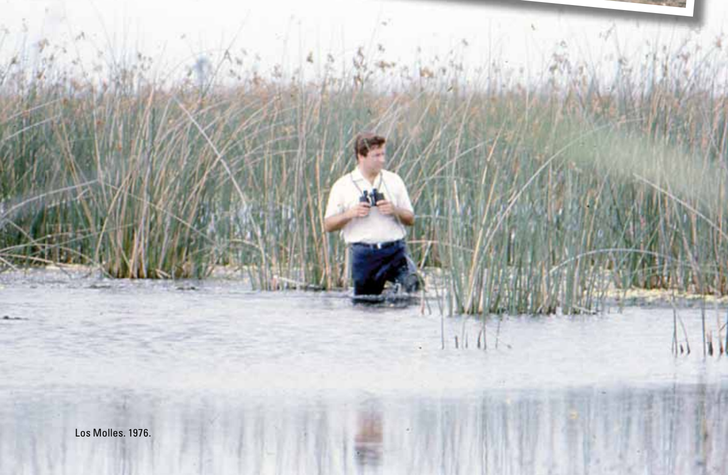
Los Molles. 1976.