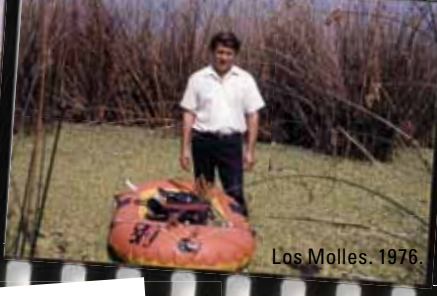
Los Molles. 1976.