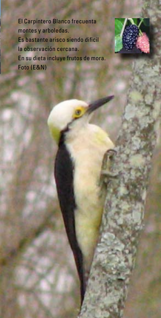
El Carpintero Blanco frecuenta montes y arboledas. Es bastante arisco siendo difícil la observación cercana. En su dieta incluye frutos de mora.