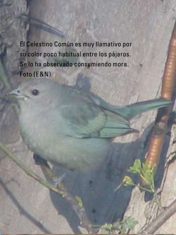
El Celestino Común es muy llamativo por su color poco habitual entre los pájaros. Se lo ha observado consumiendo mora.